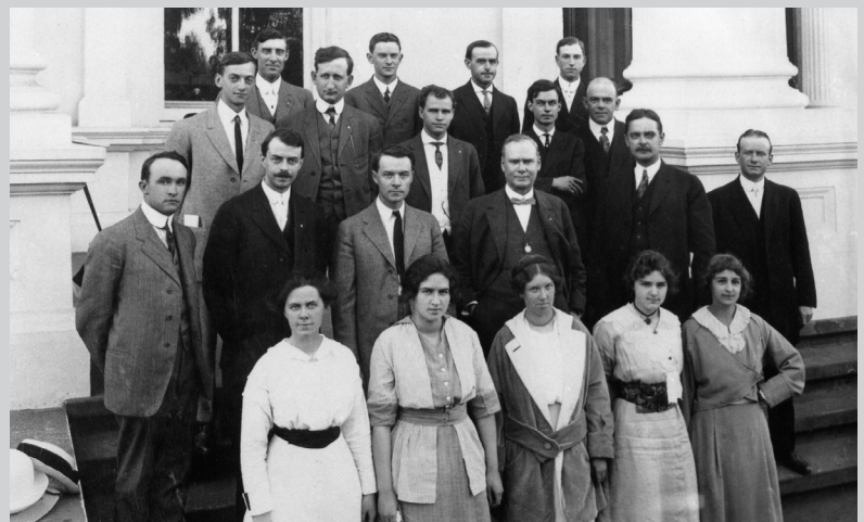
El primer trabajador de la Comisión de Accidentes Industriales del Estado ( State Industrial Accident Commission ).

Para ver más sobre la historia de SAIF y el papel que jugamos como líderes en la industria de seguros de compensación para trabajadores en Oregon, visite saif.com .